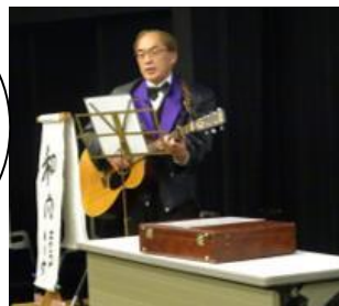
③ はっとりはんどろ 服部半童