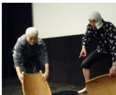
⑥ どじょう掬い二人踊